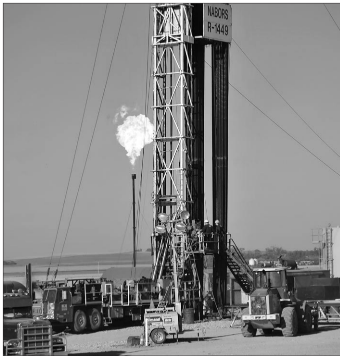
Amerikai olajkút. A tengerentúrra mennek a feltalálók